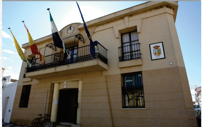
Archivo Municipal de Acehúche

ESTREMADURA Por Lopez año de 1700. y parte de la Fuera, por el Medio-dia ucia, y por el Occidente con Allen- incia del Regno de Portugal. nte a San, 52. leguas, y Norte por lo mas ancho tertilidad esta Pro- Rios Tago, y Guadiana, viesan por en medio, y chicos, que son el Almon y el Aradilla & Badajoz sa, Capital de la Provin- Obispado, y un Puente sobre diana, edificado por los Plaza de Guerra y tiene Castillos, el uno del rtugal, y del otro lado erry esta el fuerte de S. Merida y en esta Angu- nto tiempo libreza de la antigua tural de sobre el Rio Guadiana.