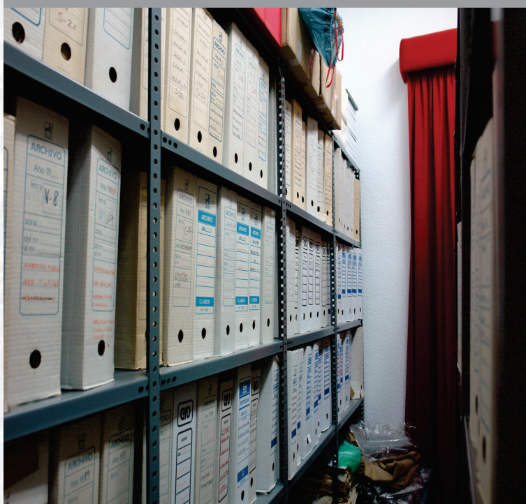
Archivo Municipal de Acehúche antes de la elaboración del Inventario.