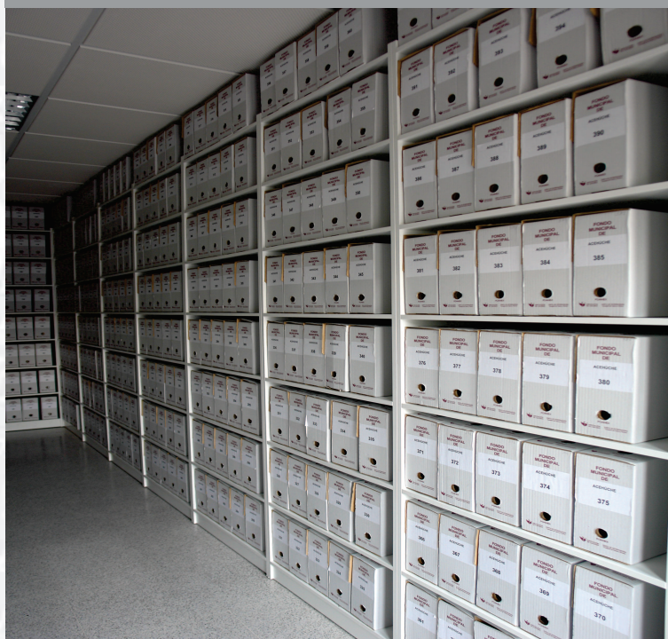
Archivo Municipal de Acehúche después de la elaboración del Inventario.