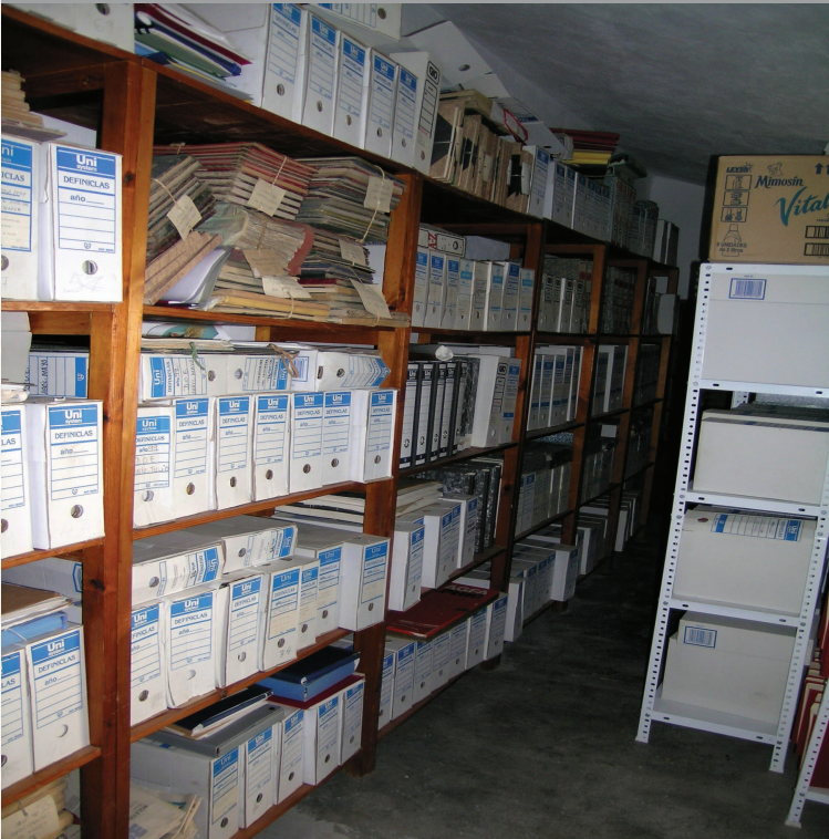
Archivo Municipal de Bodonal de la Sierra antes de la elaboración del inventario.

STREMADURA Por Lopez año de 1700. y P Fuja, por el ucia, y por el Occidente incia del Reyro de Portu nte a sus 52. leguas, y Norte por lo mas ancho territoio esta Pro- Rios Tago, y Guadiana, viesan por enmedio, y chicos, que son el Almon- y el Andilla & Badajoz la, Capital de la Provin- Ospado, y un Puente, sobre diana, edificada por los Ala de Guerra, y tiene Castillos, el uno del O reputal, y del otro lado erro esta el fuerte de S. Merida Vanecita Angu- tivo tiempo hizo a de la antigua ritica sobre el Rio Guadiana.