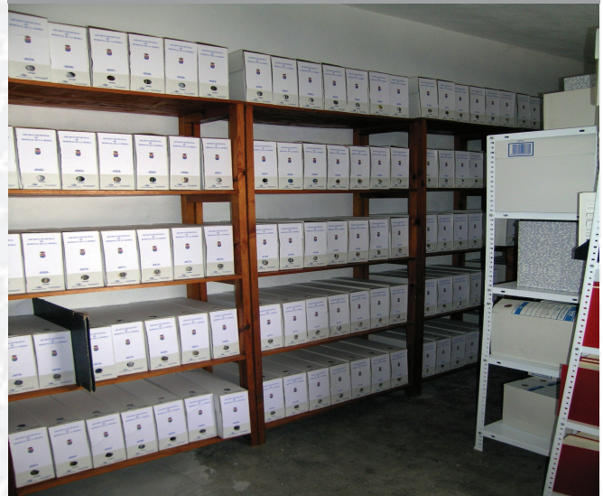
Archivo Municipal de Bodonal de la Sierra después de la elaboración del Inventario.