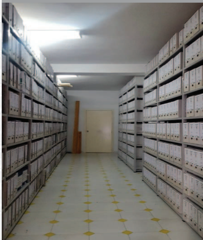
Archivo Municipal de Calamonte después de la elaboración del inventario.