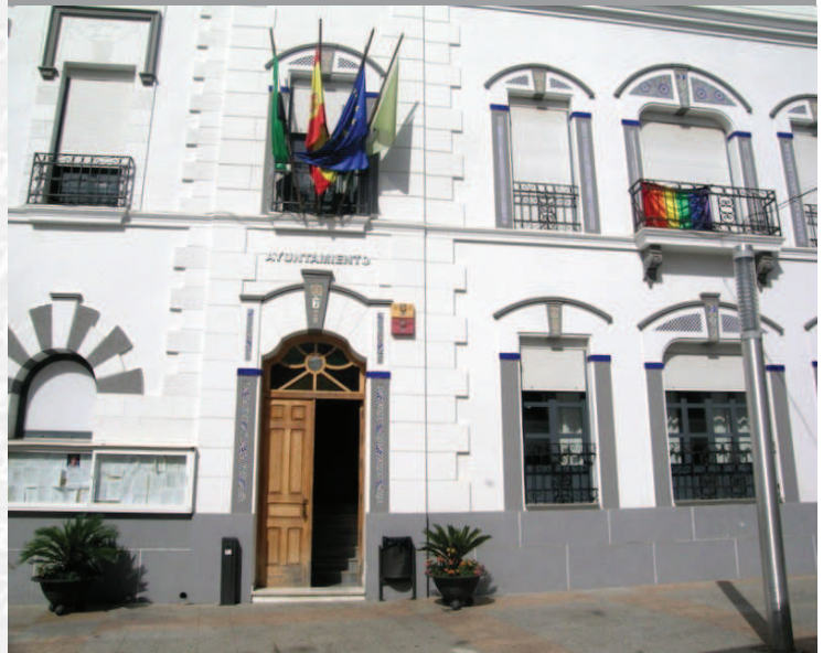
Ayuntamiento de Calamonte

STREMADURA Por Lopez año de 1700. y pa Fuera, por el ucia, y por el Occidente con alien- incia del Rey de Portugal. nte a sus 62 leguas, y Norte por lo mas ancho tertilidad esta Pro- Rios Tago, y Guadiana, viesan por en medio, y chicas, que son el di non y el stradilla & Badajoz la, Capital de la Provin- Obispado, y un Puente sobre diano, edificado por los llaza de Guerra, y tiene Castillos, el uno del regal, y del otro lado erro esta el fuerte de S. Merida, y en esta Angu- nto tiempo libre de la antigua situada sobre el Rio Guadiana.