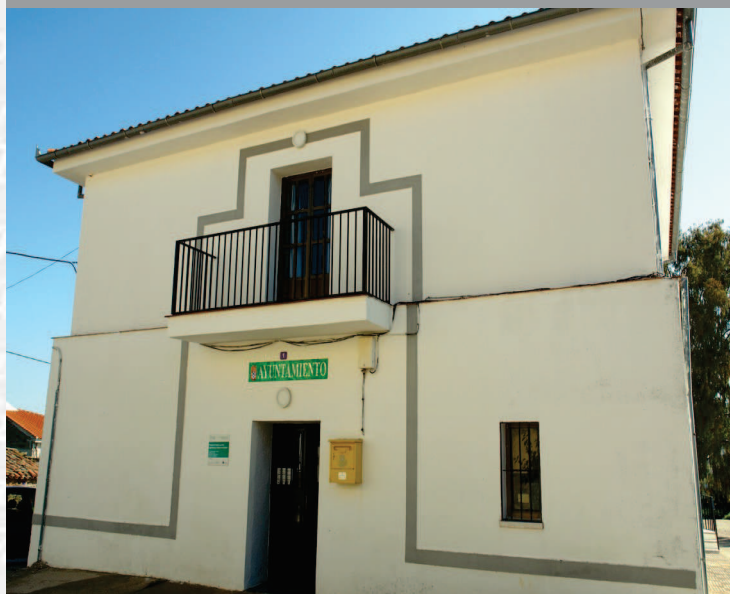
Ayuntamiento de Campillo de Deleitosa

STREMADURA Por Lopez año de 1700. y pa Fuera, por el ucia, y por el Occidente con sien- ncia del Rey de Portugal. nte a sus 62 leguas, y Norte por lo mas ancho tertilidad esta Pro- Rios Tago, y Guadiana, viesan por enmedio, y chicos, que son el diaton- y el Aradilla & Badajoz la, Capital de la Provin- Obispado, y un Puente sobre diano, edificado por los llaza de Guerra, y tiene Castillos, el uno del regal, y del otro lado erro esta el fuerte de S. Merida, y en esta Angu- nto tiempo libre de la antigua situada sobre el Rio Guadiana.