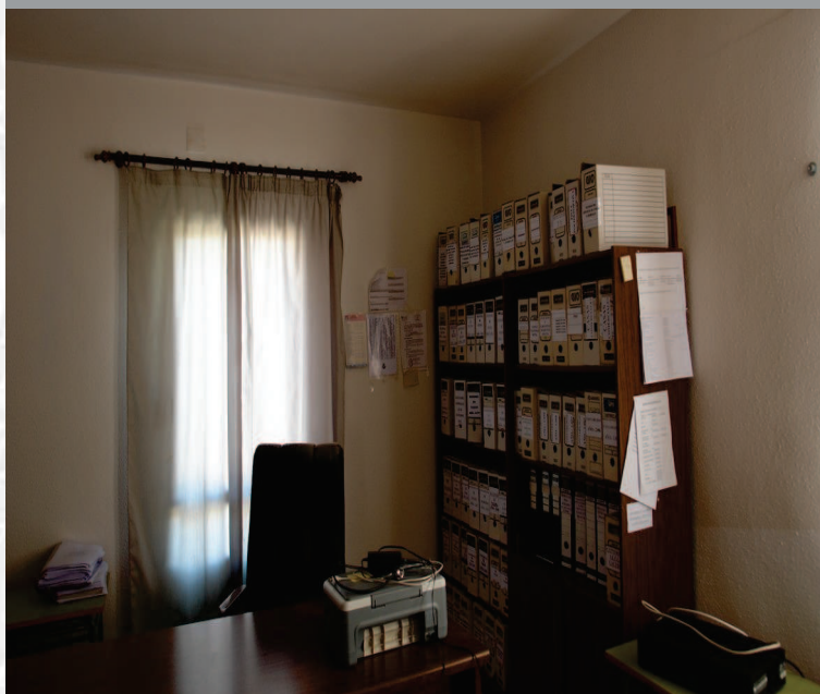
Archivo Municipal de Campillo de Deleitosa antes de la elaboración del inventario.