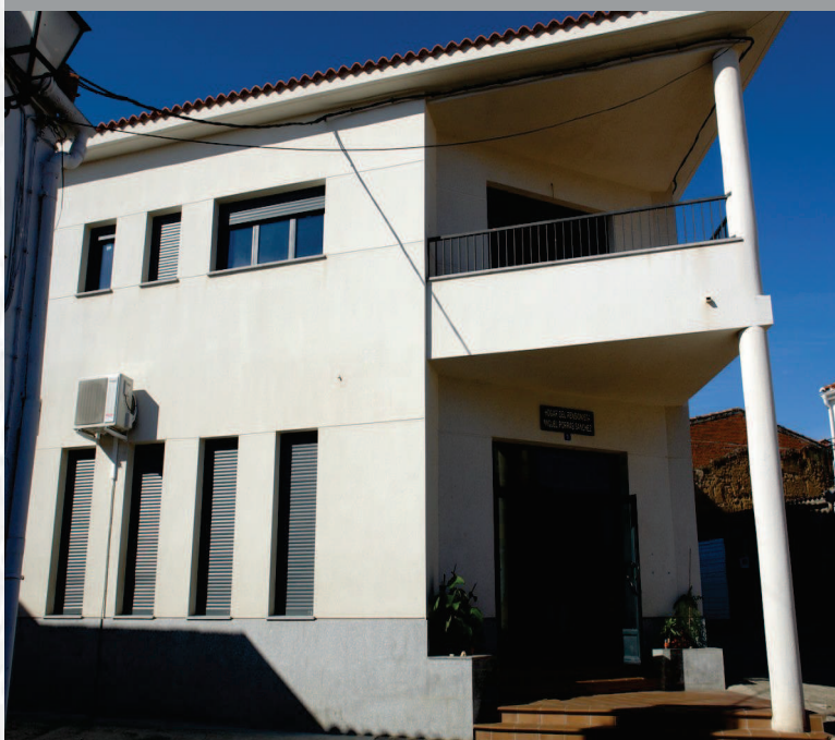
Archivo Municipal de Campillo de Deleitosa después de la elaboración del inventario.