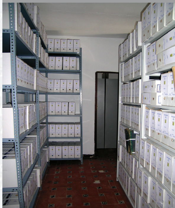
Archivo Municipal de Feria después de la elaboración del Inventario.