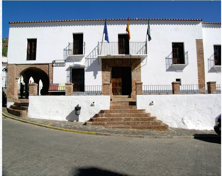
Ayuntamiento de Feria

ESTREMADURA Por Lopez año de 1700. ... y por Fuera, por el ucia, y por el Occidente con sien- ncia del Reyrio de Portugal. ... a sus 62 leguas y Norte por lo mas ancho tertilidad esta Pro- Rios Tago, y Guadiana, viesan por en medio, y chicas, que son el dion- y el stradilla & Badajoz la, Capital de la Provin- Obispado, y un Puente sobre dima, edificado por los llaza de guerra y tiene Castillos, el uno del regal, y del otro lado erro esta el fuerte de S. Merida venerata Angu- bro tiempo libeza de la antigua situada sobre el Rio Guadiana.