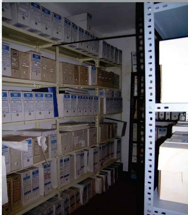
Archivo Municipal de Feria antes de la elaboración del Inventario.