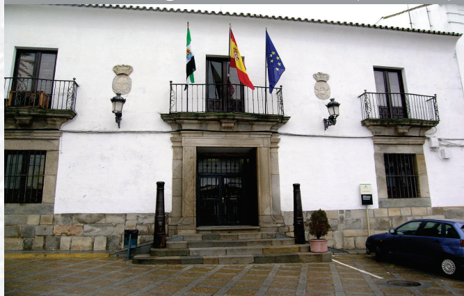
Ayuntamiento de Fregenal de la Sierra