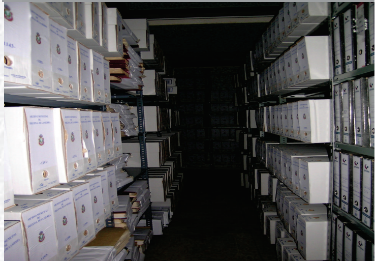
Archivo Municipal de Fregenal de la Sierra, después de la elaboración del Inventario.