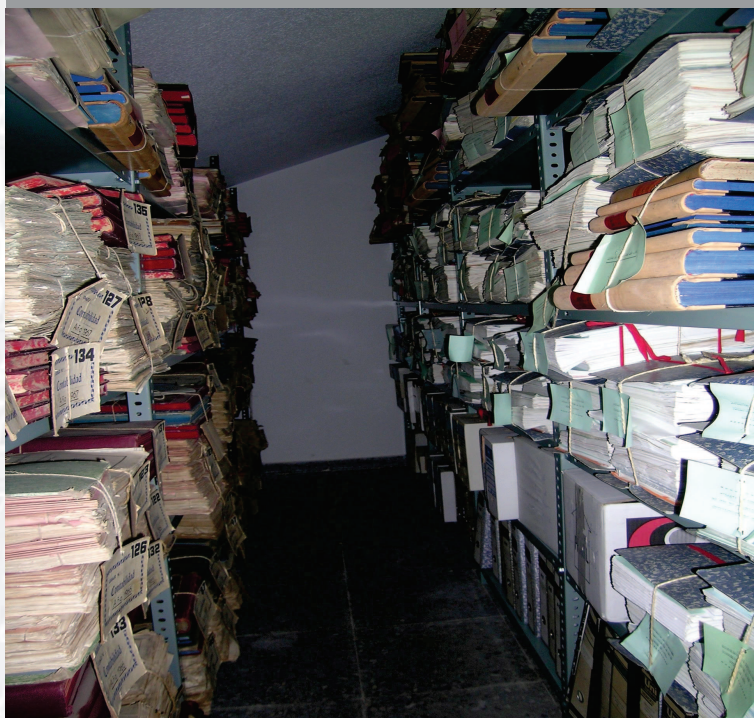
Archivo Municipal del Fregenal de la Sierra antes de la elaboración del inventario.