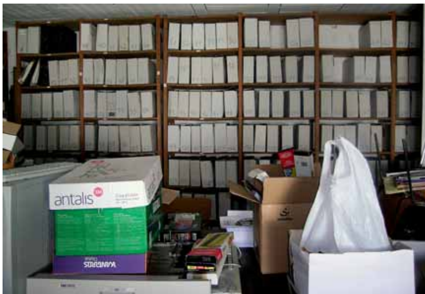
Archivo Municipal de Fuente del Arco antes de la elaboración del Inventario.