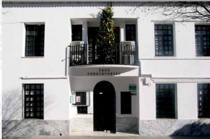
Fachada del Ayuntamiento.