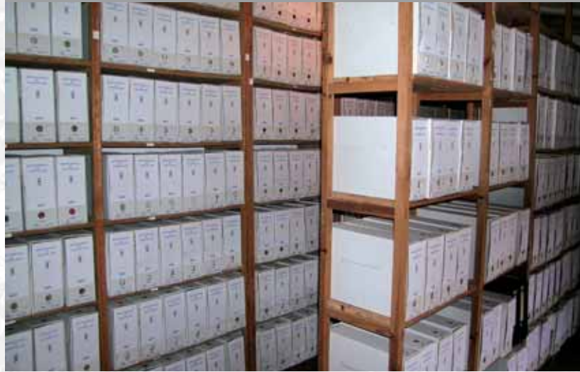
Archivo Municipal de Fuente del Arco después de elaborar el inventario.