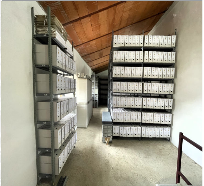
Archivo Municipal de Fuentes de León después de la elaboración del Inventario.

STREMADURA Por Lopez año de 1700. Fuera, por el ucia, y por el Occidente incia del Reyno de Port nte a sus 52. leguas, y Ovete por lo mas ancho tertilidad esta Pro- Rios Tago, y Guadiana, eviesan por enmedio, y elicos, que son el dion y el Ardilla & Badajoz la, Capital de la Provin- Obispado, y en Puente sobre diana, edificada por los Alcaza de Guerra y tiene Castillos, el uno del riginal, y del otro lado erro esta el fuerte de S. Merida la nueva Angu- nto tiempo la obra de la antigua situa la sobre el Rio Guadiana.