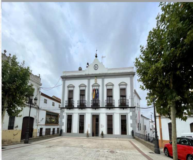
Ayuntamiento de Fuentes de León