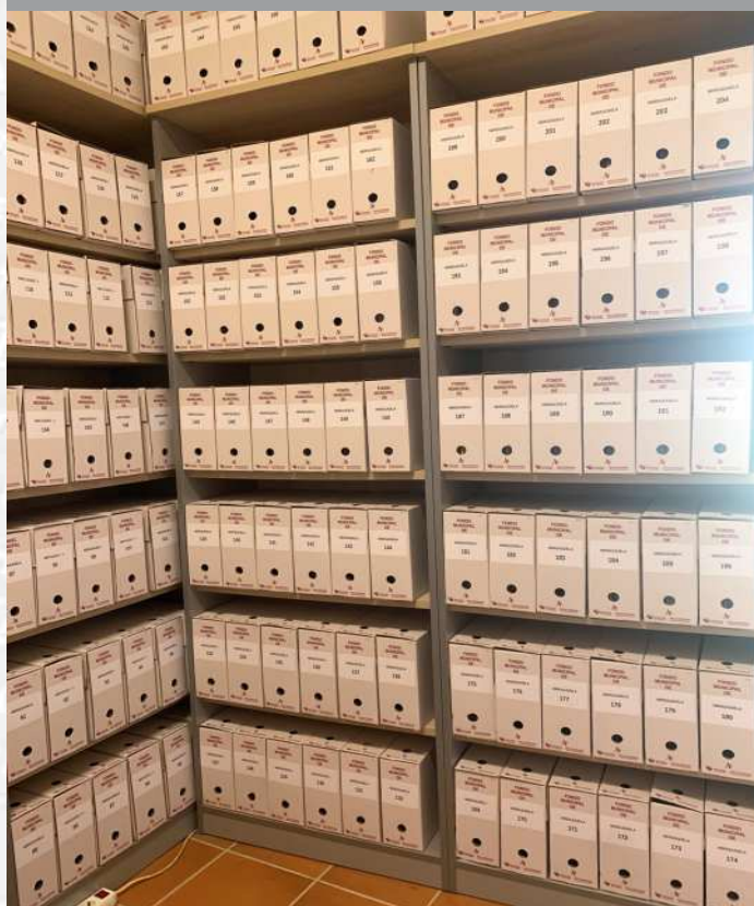
Archivo Municipal de Herguijuela después de la elaboración del Inventario.