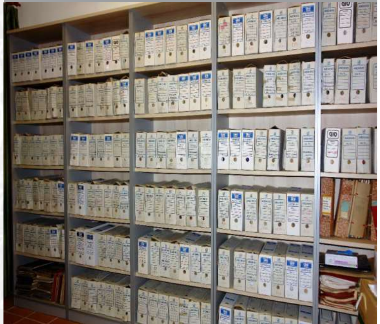
Archivo Municipal de Herguijuela antes de la elaboración del inventario.