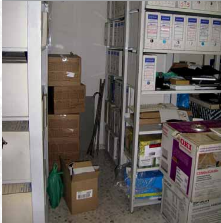
Archivo Municipal de Llera antes de elaborar el Inventario.