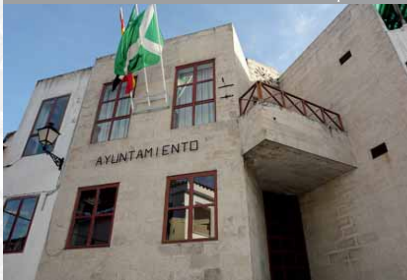
Ayuntamiento de Malpartida de Plasencia.

STREMADUR Por Lopez año de 1706. Vieja lucia, y por el O incia del Be arte a Sur, 52, aguas, y Oeste por lo mas ancho entida con esta Pro- Rios Tago, y Guadiana, viesan por en medio, y chicos, que son el demon y el arzilla & Badajoz La, Capital de la Provin Obispado, y un Puente, sobre diana, edificado por los Ala de Guerra, y tiene Castillos, el uno del O rugal, y del otro lado erro esta el fuerte de S. Merida, y en esta Angu- nto tiempo habia de la antigua situada sobre el Rio Guadiana.