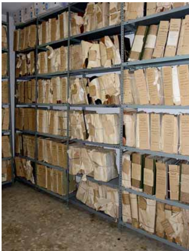
Archivo Municipal de Malpartida de Plasencia antes de elaborar el Inventario.