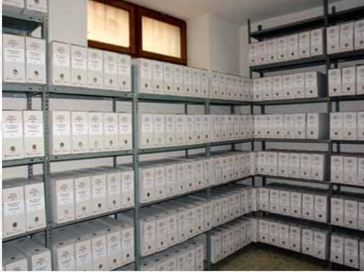
Archivo Municipal de Malpartida de Plasencia después de la elaboración del Inventario.

Vieja, por lucia, y por el Occide ncia del Reyno de Po rte a Sur, 52. aguas, y Oeste por lo mas ancho dentada en esta Pro- Rios Tago, y Guadiana, viesan por enmedio, y chicos, que son el demon y el arzilla & Badajoz La, Capital de la Provin Obispado, y un Puente sobre diana, edificado por los Ala de Guerra, y tiene Castillos, el uno del O rugal, y del otro lado erro esta el fuerte de S. Merida, famosa Augu- nto tiempo libre a de la antigua situada sobre el Rio Guadiana.