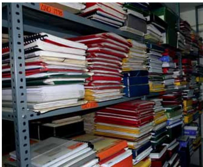
Archivo Municipal de Miajadas antes de elaborar el Inventario.