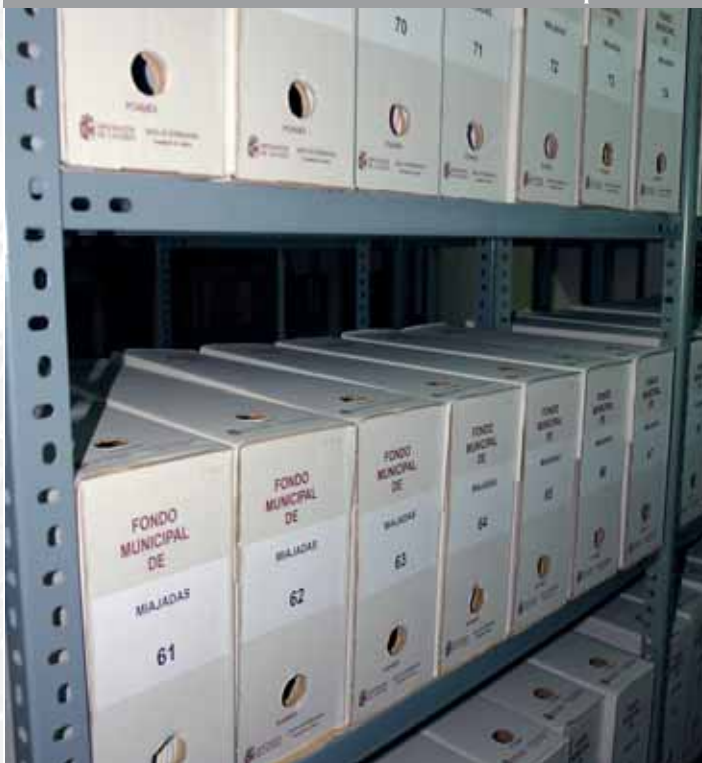
Archivo Municipal de Miajadas después de la elaboración del Inventario.