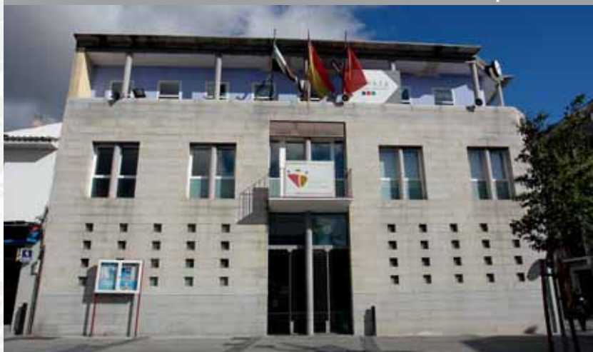
Ayuntamiento de Miajadas.