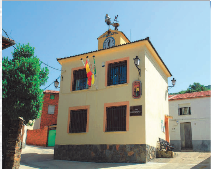
Ayuntamiento de Navatrasierra