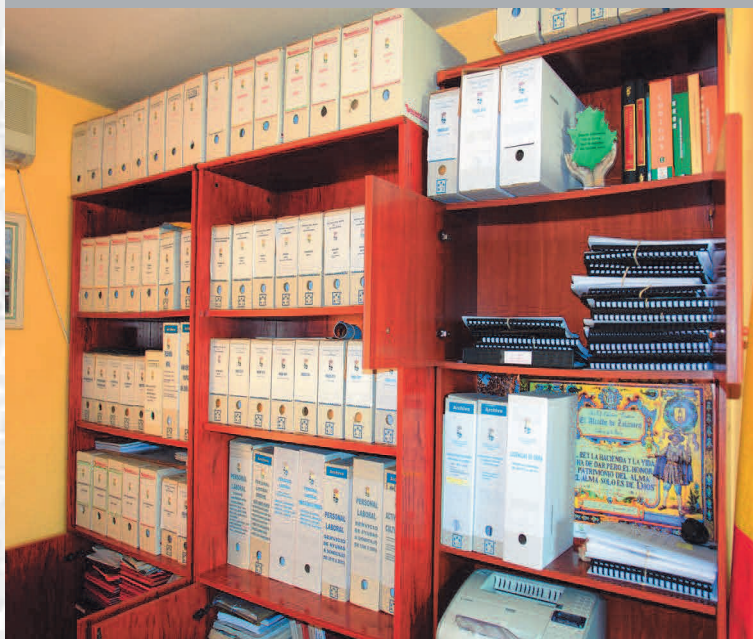
Archivo Municipal de Navatrasierra antes de la elaboración del Inventario.