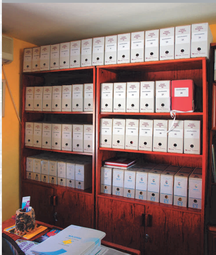
Archivo Municipal de Navatrasierra después de la elaboración del Inventario.