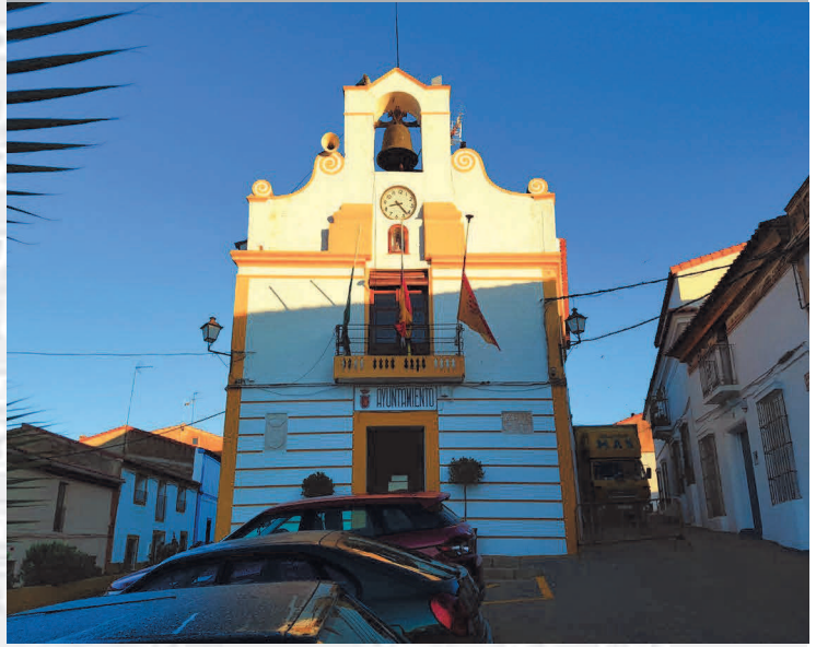
Ayuntamiento de Nogales

ESTREMADERA Don Lopez año de 1710 y por el por el y por el Occidente con sien- cia del Rey de Portugal. de a d'agua, leguas y de por lo mas ancho fertilizan esta Rio Rio de Tula, y Guadalupe, creran por erredio y chicos, y por el de y el de d'agua de Badajoz y el de la Branca de d'agua, y en Fuente de d'agua edificaron por los de d'agua y tiene de d'agua, el uno del de d'agua, y del otro lado de d'agua el suyo de S. de d'agua en la d'agua de d'agua d'agua de la d'agua de d'agua de d'agua