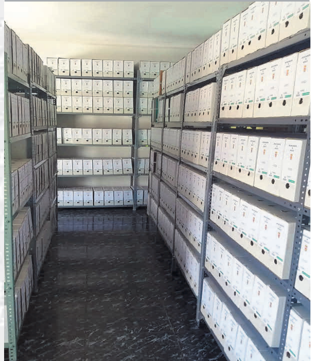
Archivo Municipal de Nogales después de la elaboración del inventario.