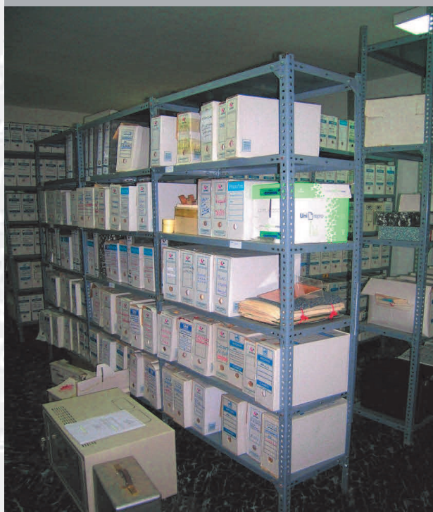
Archivo Municipal de Nogales antes de la elaboración del inventario.