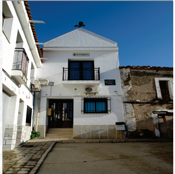
Ayuntamiento de Pescueza

STREMADURA Por Lopez año de 1700. Castilla la Nueva, por el Medio y parte de Fueja, por el Medio y ucia, y por el Occidente con Alien- ncia del Reyno de Portugal. nte a sus 52 leguas, y Norte por lo mas ancho tertilidad en esta Pro- Rios Tago, y Guadiana, viesan por en medio, y chicas, que son el diomon- y el Ardilla & Badajoz la, Capital de la Provin- Obispado, y en Puente sobre diana, edificada por los Alcaide de Guerra y tiene Castillos, el uno del O regal, y del otro lado erro esta el fuerte de S. Merida venerata Augu- nto tiempo libre de la antigua situada sobre el Rio Guadiana.