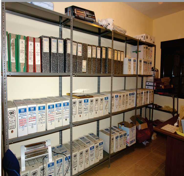
Archivo Municipal de Pescaza antes de la elaboración del Inventario.