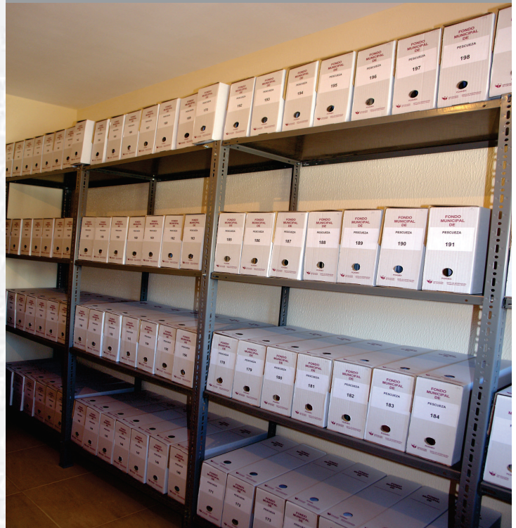
Archivo Municipal de Pescaza después de la elaboración del Inventario.

STREMADURA Por Lopez año de 1700. ... y por Fueja, por el ucia, y por el Occidente incia del Reyno de Portu nte a sus b2. leguas y Norte por lo mas ancho tertila en esta Pro- Rios Tago, y Guadiana, viesan por en medio, y chicas, que son el di non y el stradilla & Badajoz lia, Capital de la Provin- Obispado, y en Puente sobre dima, edificada por los llada de Guernu y tiene Castillos, el uno del regal, y del otro lado erro esta el fuerte de S. Merida Lanerata Angu- bro tiempo lioeza de la antigua situada en el Rio Guadiana.