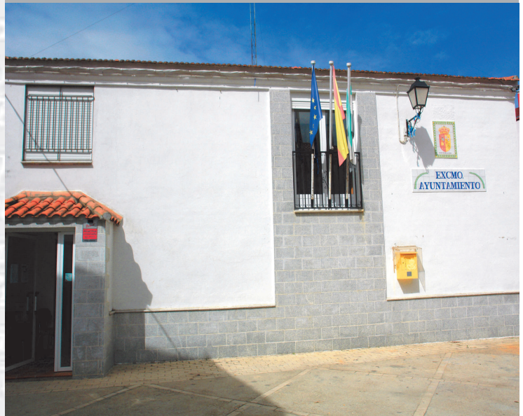
Ayuntamiento de Garvín de la Jara