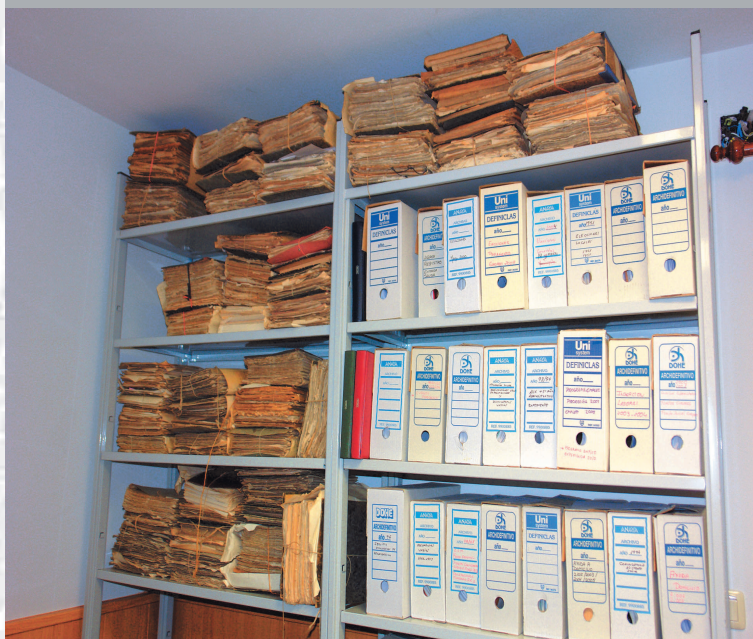
Archivo Municipal de Garvín de la Jara antes de la elaboración del inventario.