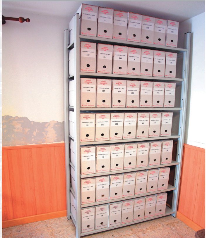
Archivo Municipal de Garvín de la Jara después de la elaboración del Inventario.