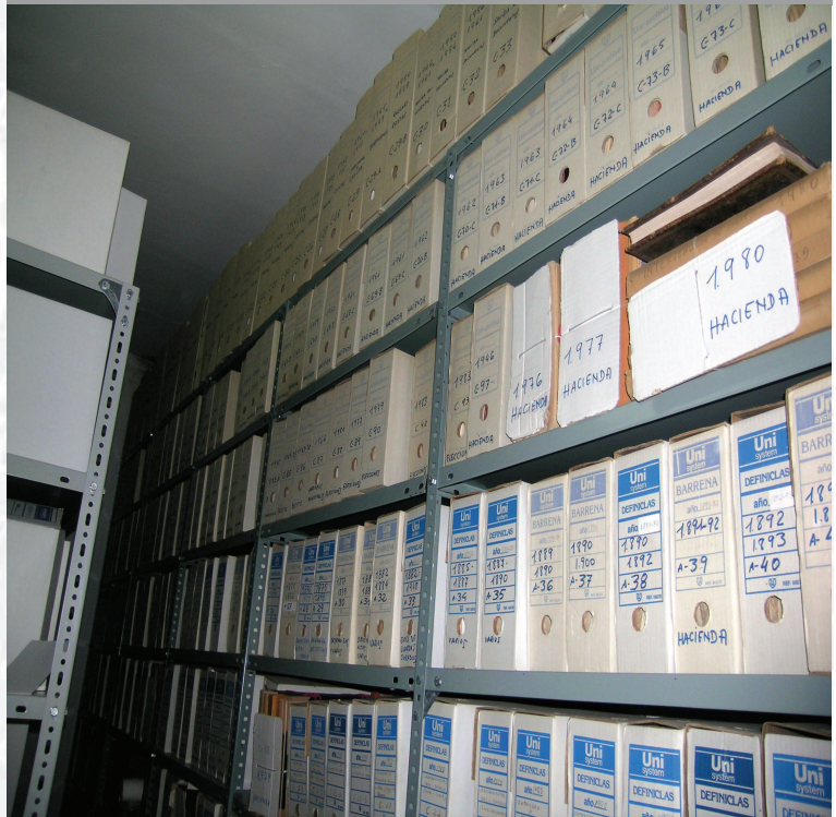
Archivo Municipal de Segura de León antes de la elaboración del Inventario.

STREMADURA Por Lopez año de 1766. Fuera, por el ucia, y por el Occidente incia del Beyro de Port nte a sus 52, leguas, y Norte por lo mas ancho territo de esta Pro- Rios Tago, y Guadiana, viesan por en medio, y chicos, que son el Almon- y el Andilla & Badajoz la, Capital de la Provin- Obispado, y un Puente, sobre diana, edificada por los Plaza de Guerra, y tiene Castillos, el uno del O nual, y del otro lado erro esta el fuerte de S. Merida la nueva Angu- tivo tiempo la boca de la antigua cualda sobre el Rio Guadiana.