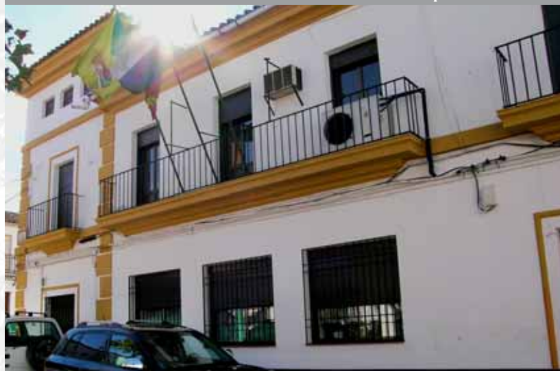
Fachada del Ayuntamiento.