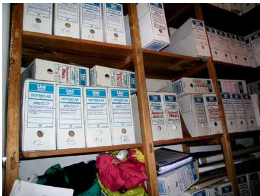
Archivo Municipal de Valverde de Llerena antes de la elaboración del Inventario.