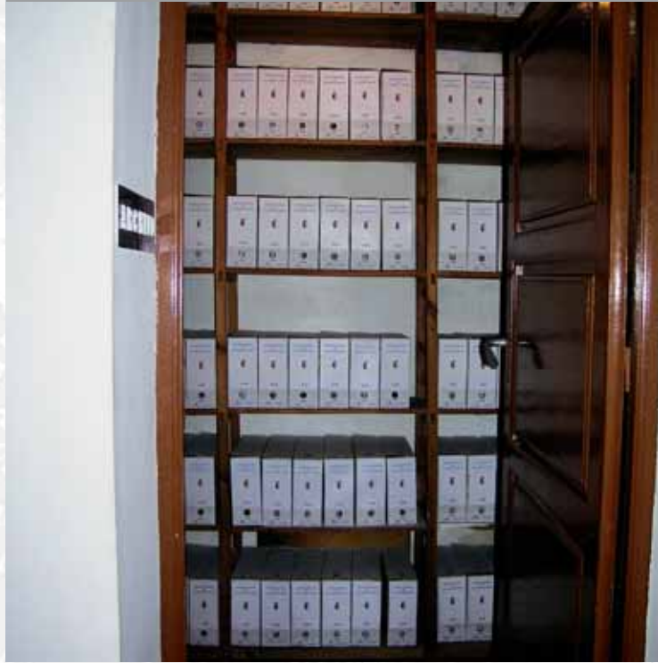
Archivo Municipal de Valverde de Llerena después de elaborar el inventario.