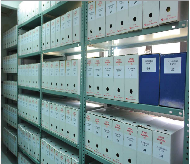
Archivo Municipal de Villasbuenas de Gata después de la elaboración del inventario.

STREMADURA Por Lopez año de 1700. Fuera, por el ucia, y por el Occidente incia del Reyno de Portugal nte a sus 52. leguas, y Norte por lo mas ancho tertiles en esta Pro- Rios Tago, y Guadiana, viesan por enmedio, y chicos, que son el diaton y el stradilla & Badajoz lia, Capital de la Provin- Obispado, y un Puente sobre diano, edificado por los llaza de guerra y tiene Castillos, el uno del nigral, y del otro lado erro esta el fuerte de S. Merida y merita Angu- bro tiempo libre de la antigua situada sobre el Rio Guadiana.