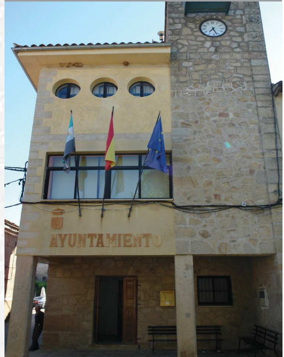
Ayuntamiento de Villasbuenas de Gata