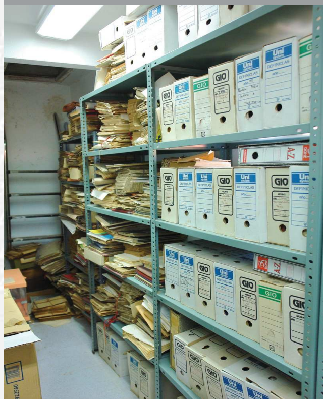
Archivo Municipal de Villabuenas de Gata antes de la elaboración del Inventario.