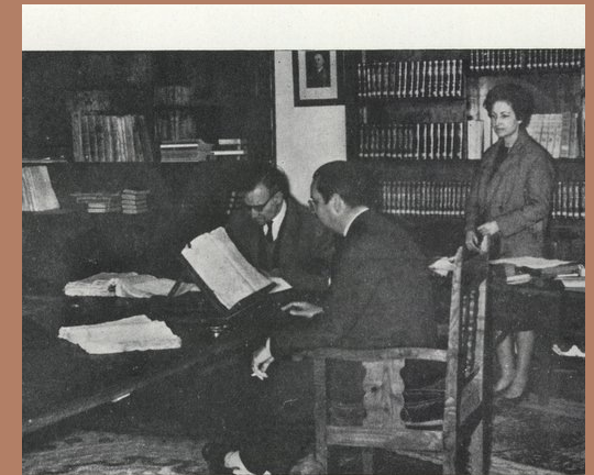
Un aspecto de la Sala de Investigadores