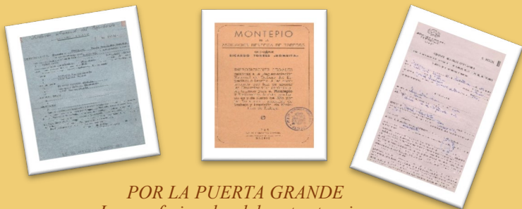
POR LA PUERTA GRANDE Los profesionales del sector taurino

Bajo el título “Por la puerta grande”, continuamos nuestro recorrido por los espectáculos de ocio y cultura. Ahora les toca el turno a los espectáculos taurinos. Para ello, daremos a conocer varios documentos, que se conservan en este archivo.