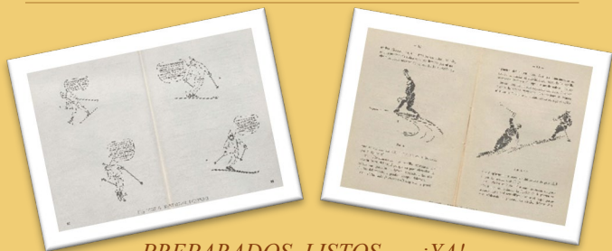
PREPARADOS, LISTOS, ... ¡YA! Deportes de invierno: Esquí

Bajo el título “Preparados, listos, ... ¡YA!”, continuamos nuestro recorrido por los espectáculos de ocio y cultura. En esta ocasión hablaremos sobre espectáculos deportivos.