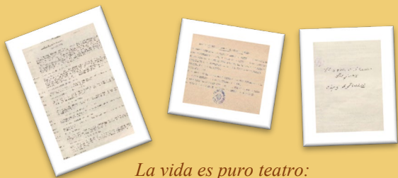
La vida es puro teatro: Guiones de Obras de Teatro

Bajo el título “La vida es puro teatro”, arrancamos con una de las actividades culturales y artísticas más antiguas que se conocen, y que tienen lugar sobre un escenario en el que se representan historias diversas a través de actores en una puesta en escena. Para ello, daremos a conocer varios documentos, que se conservan en este archivo, relacionados con diferentes aspectos pero que tienen como temática común el teatro, los cuales se irán mostrando en tres exposiciones diferenciadas.