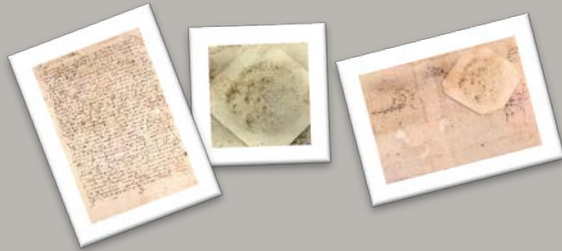
Recuperando el Patrimonio. Técnicas analíticas en la Intervención de la Concordia

Bajo el título “ Técnicas analíticas en la intervención de la Concordia entre la ciudad de Plasencia y el Obispo Gómez de Toledo sobre los diezmos nuevos ”, queremos explicar la metodología de intervención en el documento, comenzando por los estudios y análisis previos realizados en la obra. Es necesario documentar, registrar y recopilar toda la información necesaria sobre el documento y conocer los deterioros que sufre, con el objeto de determinar el tratamiento a aplicar. Las diversas pruebas analíticas (solubilidad de las tintas, medición del PH y análisis de las características físicas del soporte) ayudan a profundizar en el conocimiento de los materiales y su estado de conservación.