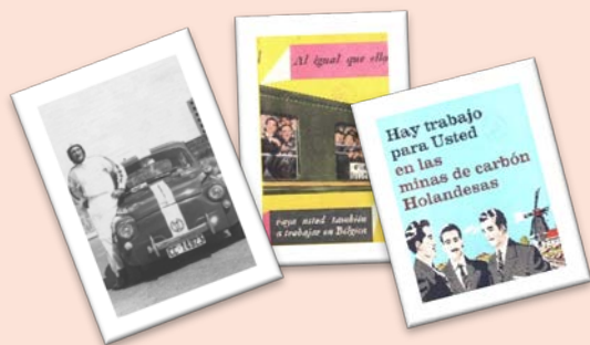
La madurez: época de búsqueda de la independencia: el primer trabajo, el carnet de conducir, el primer coche.

Bajo el título “Llegó la madurez”, se exhiben documentos relacionados con la madurez. En esta etapa de la vida, el individuo se plantea su propio futuro y proyecto de vida, formándose, buscando trabajo, montando un negocio, para independizarse económica y familiarmente. También inicia una vida en pareja y programa la creación de una familia, obtiene el carnet de conducir o se compra su primer coche. En nuestro Archivo encontramos diversos documentos que son la prueba documental de esta etapa. Los documentos que se exponen son un expediente de autorización de permiso de circulación del vehículo Clement, de 1900; varios folletos sobre la emigración de trabajadores a Holanda, Alemania y Bélgica, de 1962-1964; un contrato conjunto de trabajo de un cantante y tres músicos para la sala de fiestas Casablanca de Miajadas, de 1.970; un carnet de conductor militar otorgado por el servicio de automovilismo del ejército, de 1939 y varias fotografías de la Colección del Archivo.