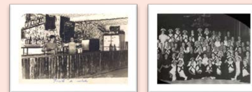
ES.10037.AHP /19.01//FOT/:1978, 730

En la exposición se exhiben 13 fotografías de la colección del archivo donde se retratan diversas escenas de la vida cotidiana relacionadas con distintos trabajos: fotógrafo, maestras, enfermeras, vendedores ambulantes, alfarero, cabrero, albañiles, aguadoras y emigrantes.