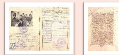
ES.10037.AHP/36.3.78.11//H-CL/156:24 ES.10037.AHP/49.2.4.05//DPAS/318 ES.10037.AHP/48.01//STCBS/120:3028

Las cartas de dote declaraban los bienes que una mujer aportaba al matrimonio” se encontraba legislada en las Partidas de Alfonso X. Los Libros de familia se crean en 1915 y hoy, con la Admon. Electrónica, deja de existir. Los títulos de familia numerosa aportaban beneficios a las familias de más de 4 hijos.