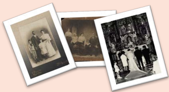
El matrimonio: época en la que se crean vínculos entre personas con un proyecto de futuro en común.