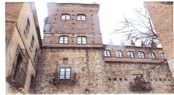
Palacio de Toledo- Moctezuma

Está situado intramuros, al noreste junto a la muralla, accediendo por el Arco de la Estrella desde la plaza Mayor, a la derecha, en la plaza del Conde de Canilleros.