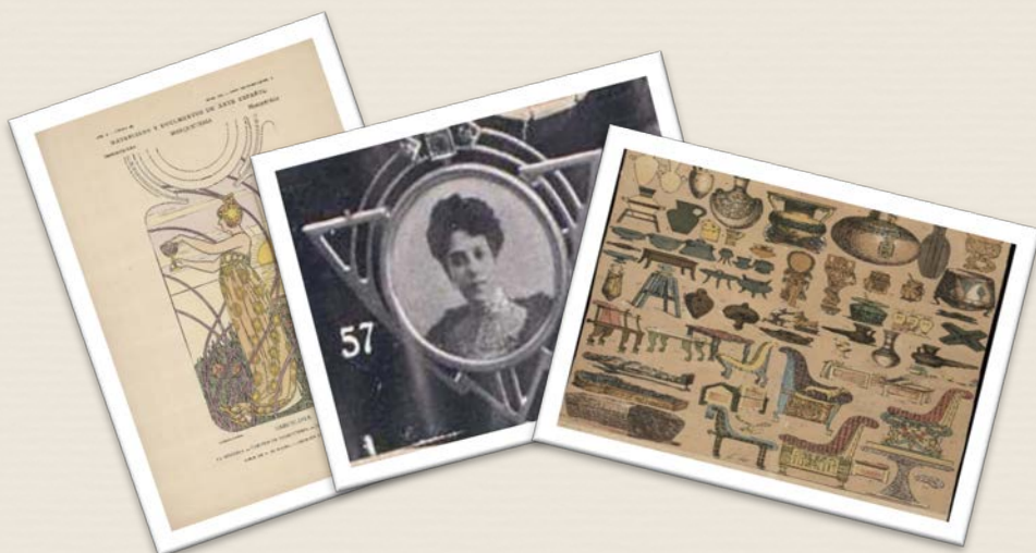
Vicente Paredes fue coleccionista de libros, manuscritos y objetos de diversa índole

En su faceta de coleccionista acumuló a lo largo de su vida gran cantidad de documentos de temas variados, algunos de enorme rareza para llevar a cabo sus investigaciones o simplemente por el interés de conocer y atesorar cosas variadas que despertaban su curiosidad. Esta inquietud le llevó a adquirir y coleccionar diversos documentos raros como los que exhibimos, colecciones de papel sellado, de estampas, de fotografías, de dibujos, de recortes de periódicos o manuscritos de diversos temas como la colección de monografías sobre la historia de los municipios de la provincia de Cádiz escritas por Domingo Sánchez del Arco, acompañados de fotografías y dibujos que las ilustran.