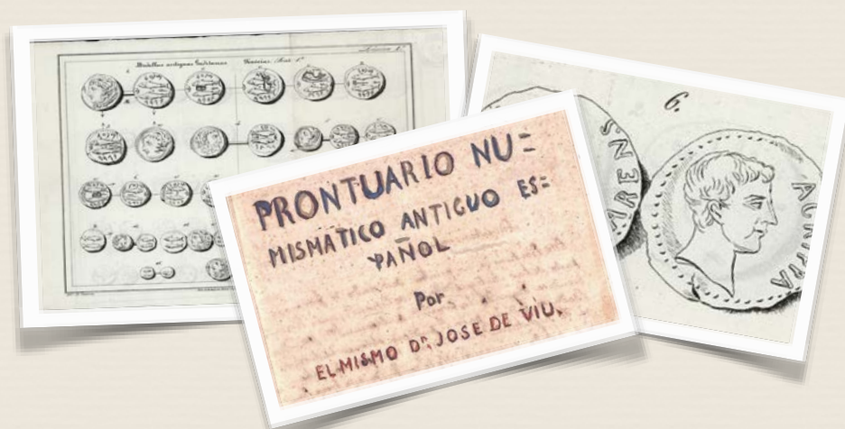
Coleccionista de monedas y estudioso de la disciplina que las estudia: la numismática.

Otra de sus grandes pasiones fue la numismática. Esta le llevó a coleccionar a lo largo de los años numerosas monedas a través de adquisiciones, hallazgos e intercambios que hacía con otros coleccionistas. Esta afición está muy unida a la de la arqueología y al interés que manifestó por conocer la historia sobre los intercambios y la economía de los pueblos. Donó su colección de numismática al Museo de Cáceres, como se recoge en el inventario que aparece en su testamento. Los documentos que se exponen destacan su interés por el coleccionismo y el conocimiento de esta disciplina: Litografías de monedas fenicias de Cádiz y Litografías de monedas latinas de Cádiz, de finales del siglo XIX y el manuscrito Prontuario numismático antiguo español, escrito por D. José de Viu en 1849.